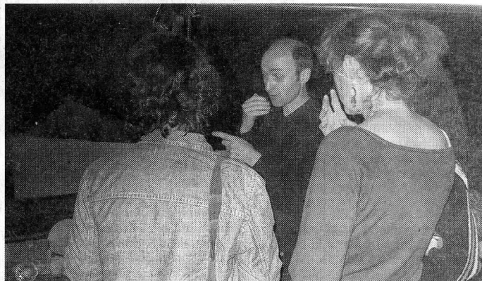
Le public a pu rencontrer l'artiste à la fin de son spectacle.

À noter qu'un second livre de photos est en cours de préparation, toujours sur le même thème et qui présentera des clichés provenant de toutes les Vosges, d'est en ouest, du nord au sud.